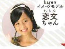
karen イメージモデル れもん 恋文ちゃん

各店舗に通われているLittle Ladyをご紹介するコーナー♡誌面に登場頂けるLittle Ladyも、随時募集中です！