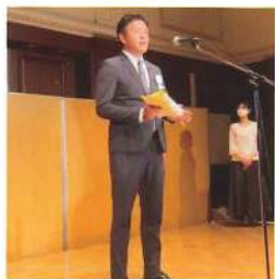
奥迫社長より直接賞状を頂き、久々に大勢の方々の前で話す機会を与えて頂きました。