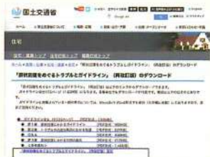
「原状回復をめぐるトラブルとガイドライン」（再改訂版）

トラブルが急増し大問題となっていた賃貸住宅の原状回復（敷金）についてのルールを明確にし、適正な契約を目的に国土交通省が公表した「原状回復をめぐるトラブルとガイドライン」（再改訂版）」を指す。国土交通省のHPからDL出来る。