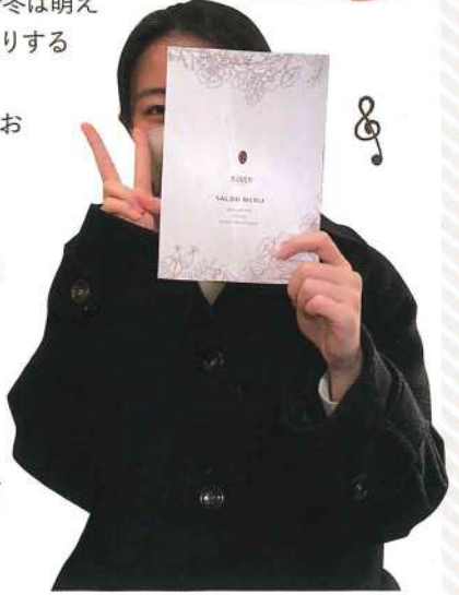
Hちゃん ✨ ✨ ✨

♪ 担当 吉岡 ♪ いつも明るく美意識が高いHちゃん♪ 美の話をするといつも嬉しそうで会話が盛り上がりますね。脱毛を始めた頃には比毛質が細く、毛穴も目立たなくなって私も嬉しく思います。元々お肌がとても綺麗なので、今よりも更に美しくそしてご満足頂ける様しっかりお手入れさせていただきます。究極の美肌になられ、世界中を飛び回って下さいね☆