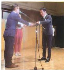
昨年日航ホテルで開催された、リセラ主催のアワードディングパーティー。九州・中国・四国地区では株式会社カンナが仕入額第1位の「リーディング賞」を頂きました。

同時に、スタッフが商品について良く勉強し、実際に使ってみるリセラの素晴らしさをお客様にしっかり伝えられて